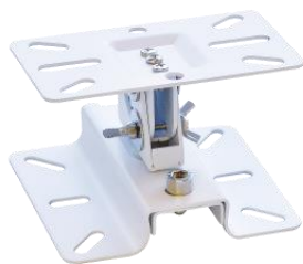
天吊り用スピーカハンガー MSH-2000Ⅲ