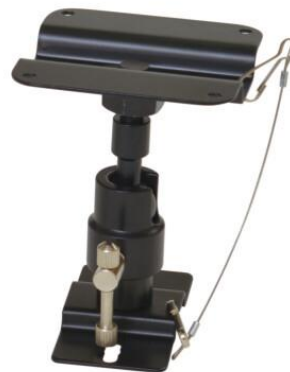
天吊り用スピーカハンガー SH-2000Ⅱ